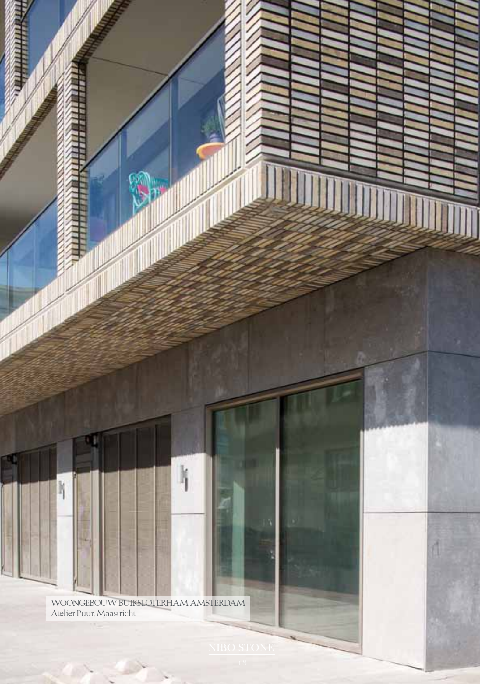
WOONGEBOUW BUIKSLOTERHAM AMSTERDAM Atelier Puur, Maastricht