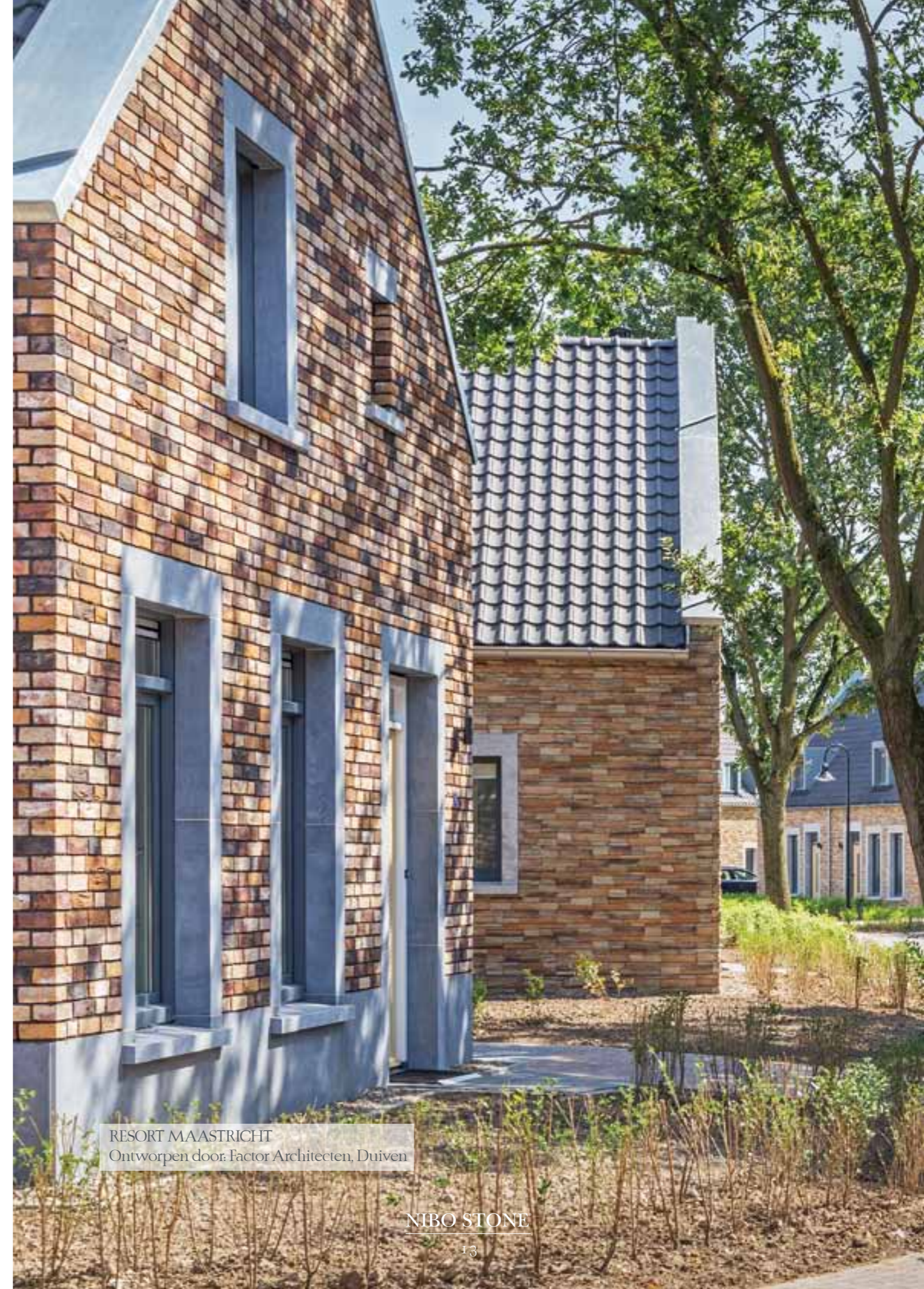
RESORT MAASTRICHT Ontworpen door: Factor Architecten, Duiven

Onze producten worden volgens onze strenge verpakkingseisen verpakt, desgewenst gemerkt en in blokken geleverd. Indien gewenst, levert en monteert Nibo Services ook de isolatie voor bijvoorbeeld gevelbekleding.