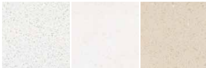
Nibo Marmercompositiet Bianco C gepolijst