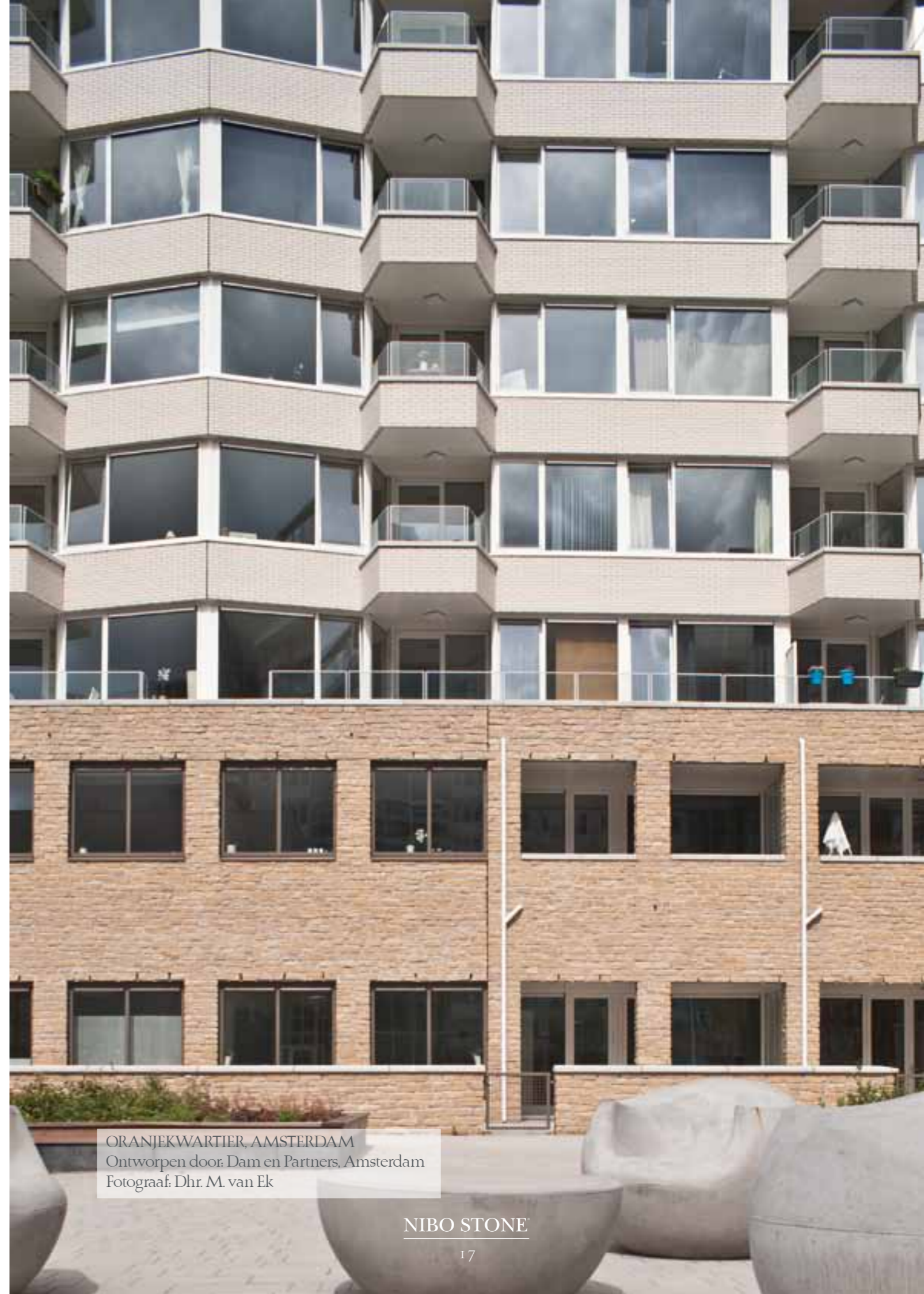
ORANJEKWARTIER, AMSTERDAM Ontworpen door: Dam en Partners, Amsterdam

Meer projecten vindt u op www.nibostone.nl