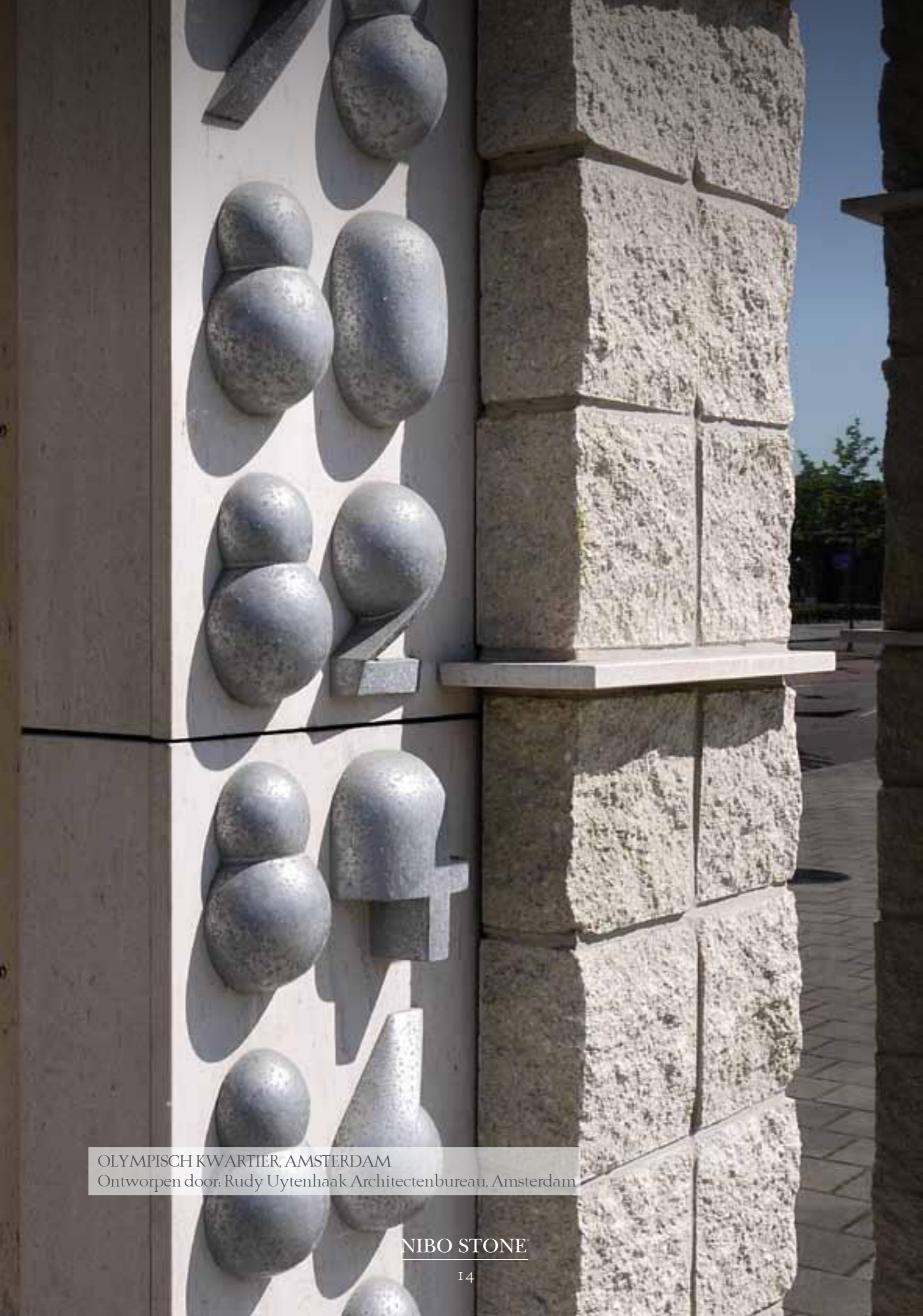
OLYMPISCH KWARTIER, AMSTERDAM Ontworpen door: Rudy Uytenhaak Architectenbureau, Amsterdam