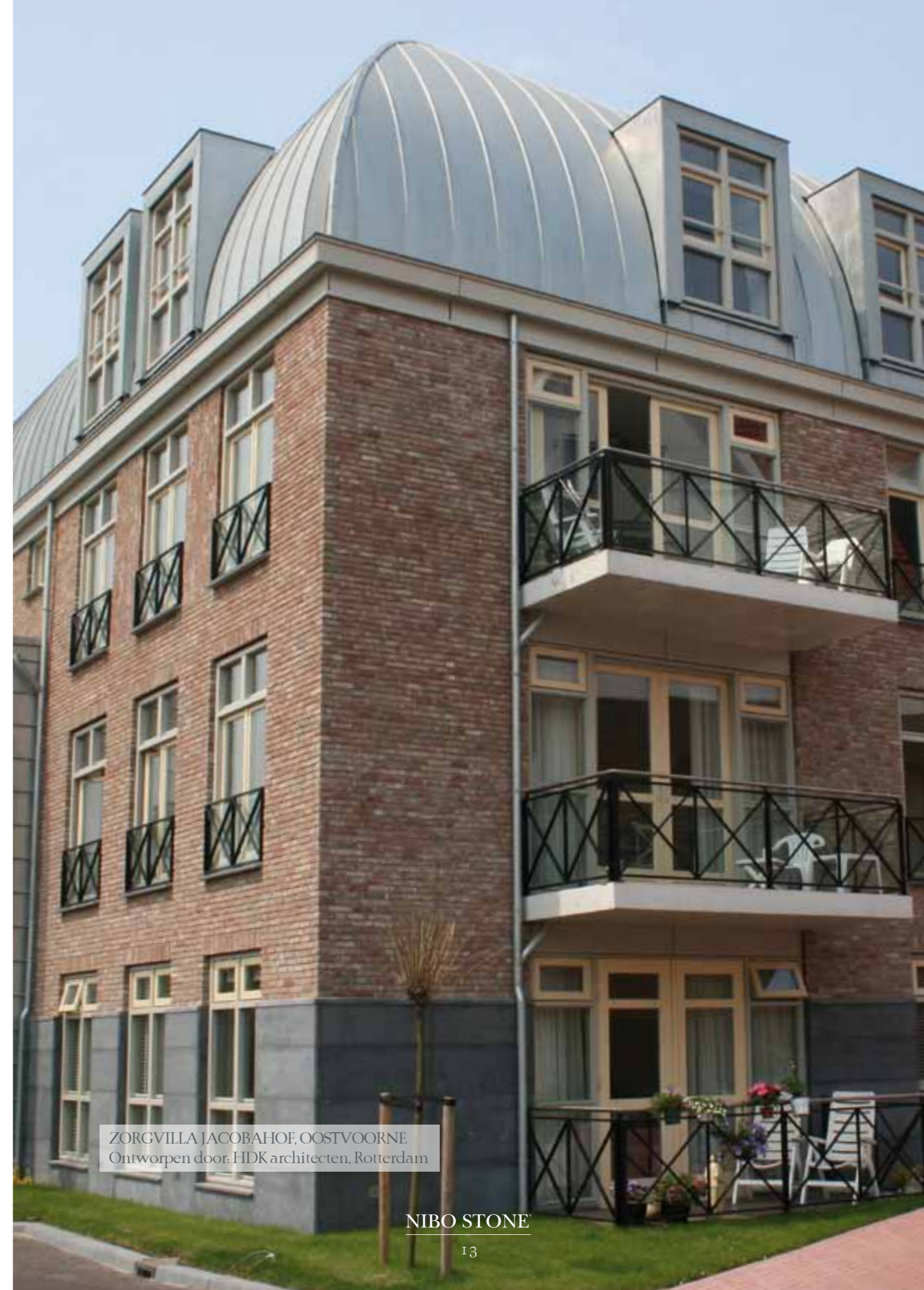
ZORGVILLA JACOB AHOF, OOSTVOORNE Ontworpen door: HDK architecten, Rotterdam

Meer projecten vindt u op www.nibostone.nl