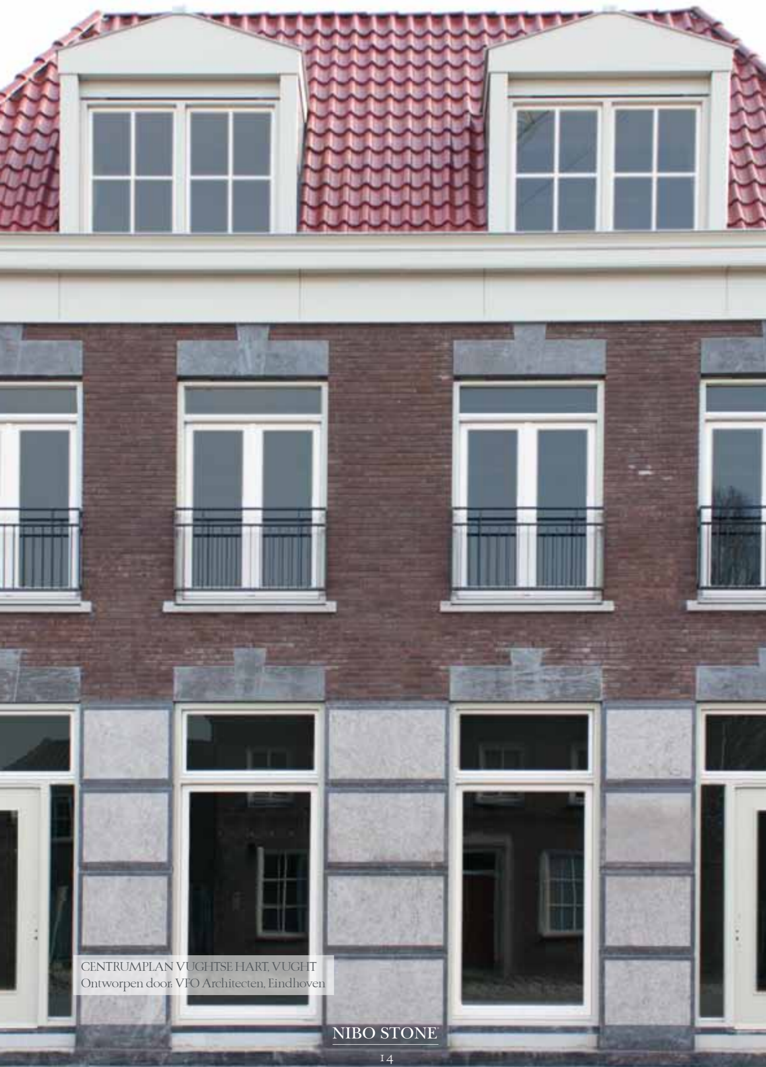
CENTRUMPLAN VUGHTSE HART, VUGHT Ontworpen door: VFO Architecten, Eindhoven