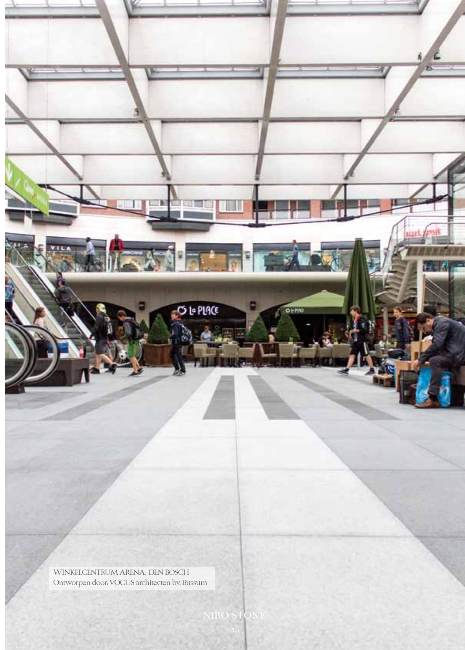
WINKELCENTRUM ARENA, DEN BOSCH Ontworpen door: VOCUS architecten bv, Bussum

Vraag naar ons inspirerende magazine over vloeren.