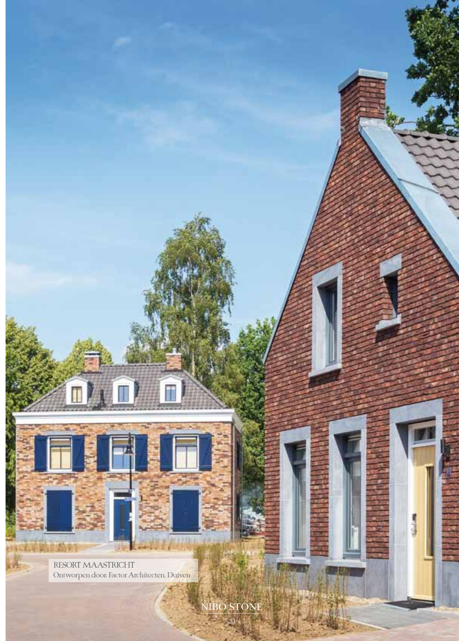
RESORT MAASTRICHT Ontworpen door: Factor Architecten, Duiven

Geheel op maat vervaardigt Nibo Stone brievenbussen. De inmetel briefplaat kan al dan niet voorzien zijn van een uitstekend schuingekant regelafschot met ingeslepen druipgoot. Desgewenst kan de brievenbus worden voorzien van een inscriptie van bijvoorbeeld huisnummer of naam. De briefplaten worden veelal geschuurd of gezoet afgewerkt. Andere bewerkingen zijn uiteraard tevens mogelijk. Ook vrijstaande brievenbussen in een natuursteensoort naar keuze behoren tot de mogelijkheden.