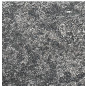
gevlamd en geborsteld