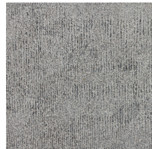
mechanische oude frijnslag