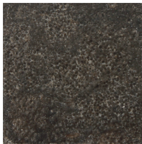
gezoet en geborsteld